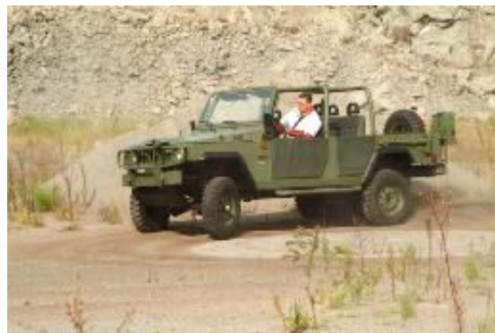
Linha de produção do MARRUÁ AM-1 em Caxias do Sul, RS e versão longa que originou a VTL.

Agora começam a colher os frutos de sua ousadia e visão e as notícias são boas, pois o EXÉRCITO homologou a versão VTL – VIATURA TÁTICA LEVE (AM-L) (ver artigo: VIATURA TÁTICA LEVE DE RECONHECIMENTO AGRALE – UMA NOVA EVOLUÇÃO NO CONCEITO 4x4 PARA O EB - http://www.defesa.ufjf.br/arq/Art591.htm ) e já encomendou 17 unidades, além de mais 40 da versão padrão AM-1 , que se somarão aos 9 adquiridos recentemente e já em uso, bem como 11 da versão CARGO , mais longo, na faixa de ¾