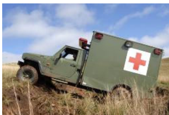
Marruá Cargo ¾ ton do 19º GAC em Santiago, RS e versão Ambulância UTI que poderá ser adotada no futuro.

No âmbito da MARINHA , o CFN – CORPO DE FUZILEIROS NAVAIS acaba de homologar a versão padrão do MARRUÁ ¼ ton (AM-1) e já adquiriu 29 unidades que substituirão as versões mais antigas do Toyota Bandeirante, e em breve as Land Rover, ambos não mais produzidos no país.