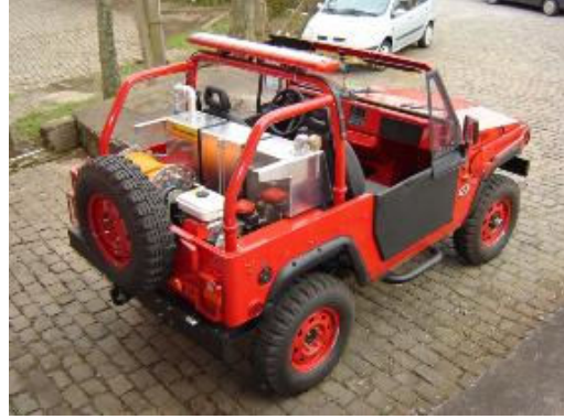
Marruá versão curta e longa empregados por empresas de eletricidade e versão bombeiro. (Fotos: Agrale)

Enfim o país passa a ter um jipe 100% nacional que atende às necessidades das Forças Armadas e garante uma cadeia logística dentro de nossa realidade, além de gerar conhecimentos, empregos, mostrando a nossa capacidade de criação e com grandes chances de ocupar um lugar de destaque no mercado internacional.