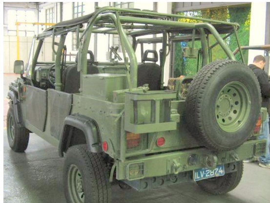
Marruá VTL (AM-L)