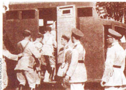
Soldados embarcando no caminhão transporte de tropas blindado. Notar a blindagem da porta