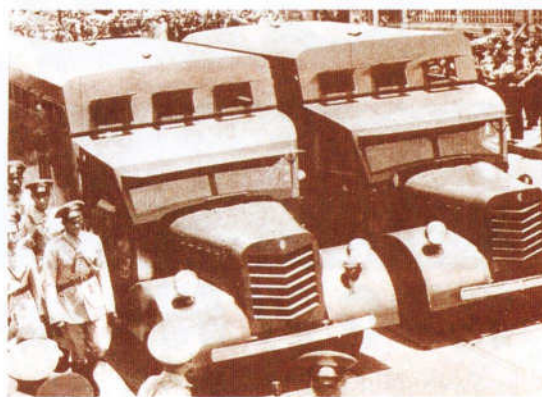
Dois caminhões transporte de tropas blindados Wilton-Fijenoord no desfile de apresentação em São Paulo, abril de 1936

Os caminhões Wilton-Fijenoord usados para o transporte de tropas, que não se sabe ao certo quando e quantos foram construídos, foram montados sobre o chassi de cami-