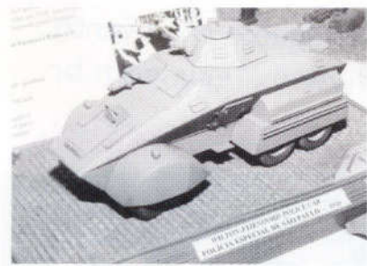
Maquete construída pelo autor na escala 1:35 do Wilton-Fijenoord Police Car