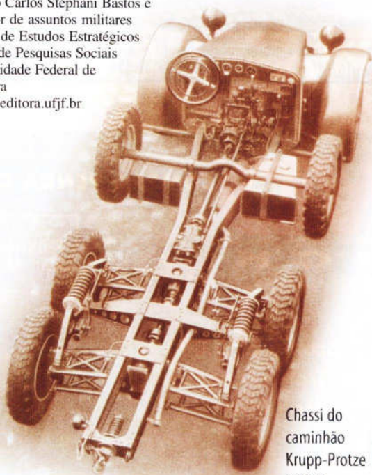
Chassi do caminhão Krupp-Protze L2H43