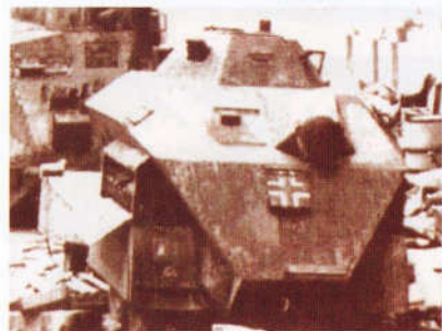
Blindado Wilton-Fijenoord Police Car destruído pelos russos no pátio interno da Chancelaria do Reich, em Berlim - abril de 1945